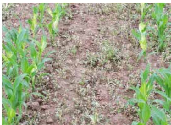
Callisto (mésotrione) zonder Delfan Plus