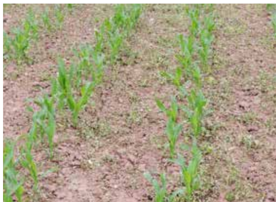
Callisto (mésotrione) met Delfan Plus (dosage: 2ltr/ha)